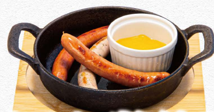
ウィンナー盛り合わせ