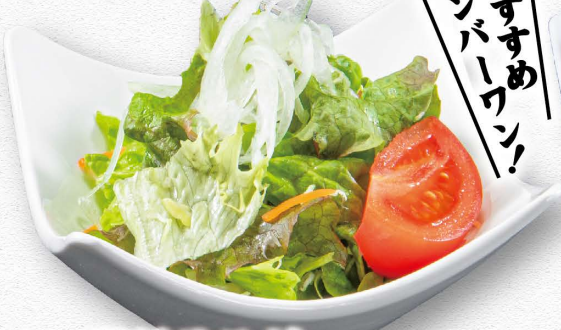
単品サラダ 330円(税込)