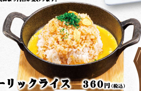
ガーリックライス 360円(税込)