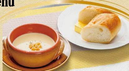
洋風セット 480円(税込) ライスorパン + スープ