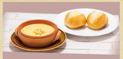
洋風セット 480円(税込) ライスorパン + スープ