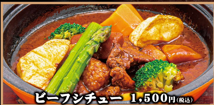
ビーフシチュー 1,500円(税込)