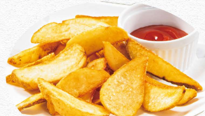
ポテトフライ 360円(税込)