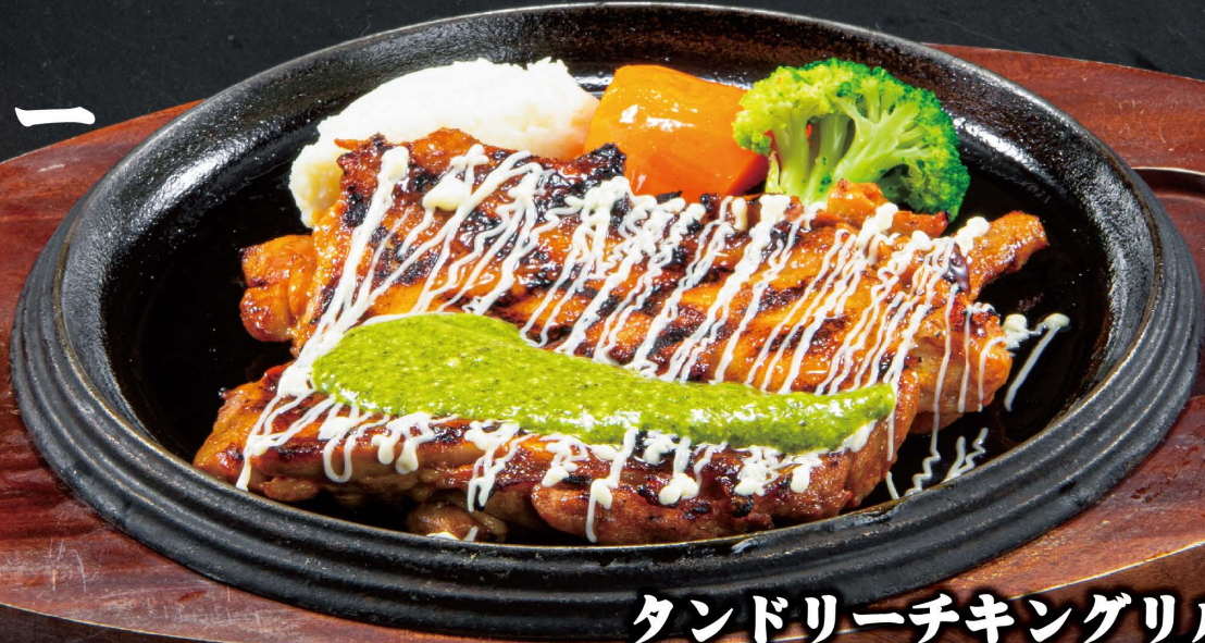
タンドリーチキングリル 1,010円(税込)