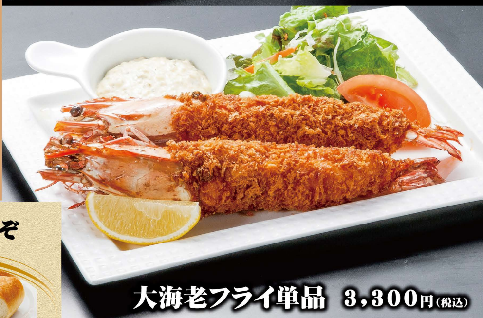
大海老フライ単品 3,300円(税込)