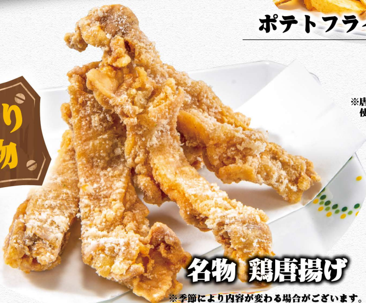
名物 鶏唐揚げ 610円(税込)