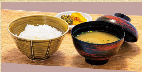
和風セット 410円(税込) ご飯 + 漬物 + 味噌汁