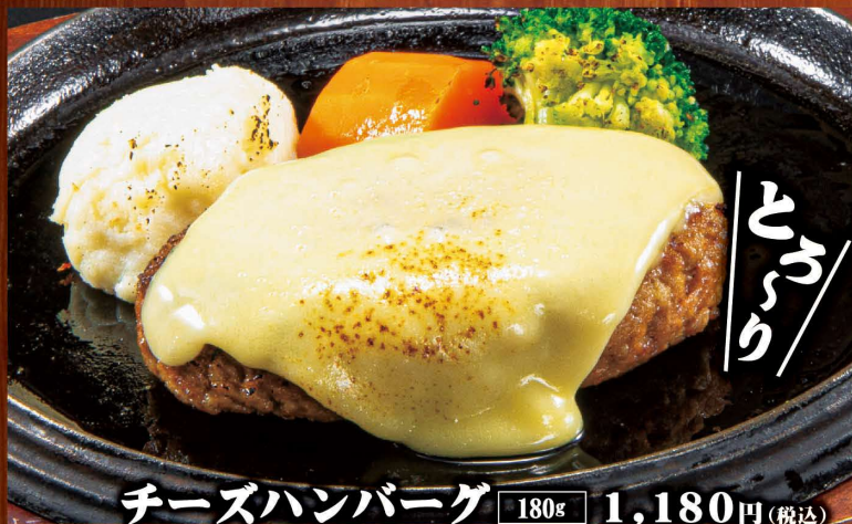
チーズハンバーグ 180g 1,180円(税込)