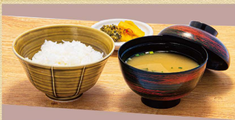
和風セット 410円(税込) ご飯 + 漬物 + 味噌汁