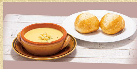
洋風セット 480円(税込) ライスorパン + スープ