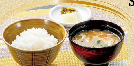
和風セット 410円(税込) ご飯 + 漬物 + 味噌汁