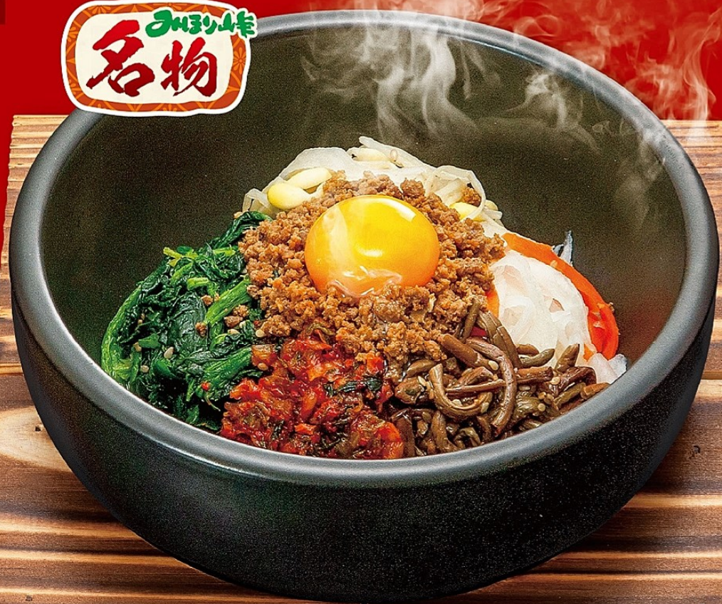
石焼ビビンバ 880円 アレルギー(特定原材料) 小麦・卵・えび (税込968円)