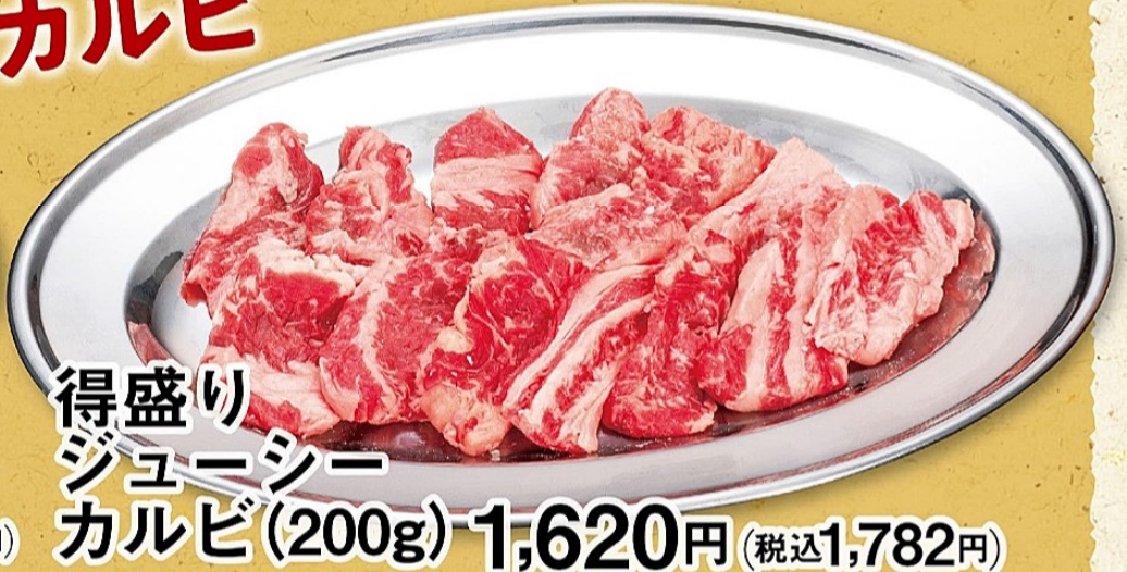
得盛り ジューシー カルビ (200g) 1,620円 (税込1,782円)

当店のたれについて ...アレルギー(特定原材料) しょうゆダレ|小麦 みそダレ|小麦 塩ダレ|小麦・乳 ※写真はタレが付いておりませんが、実際の注文商品にはタレがかかっています。 ※盛り付けは写真と異なる場合がございます。