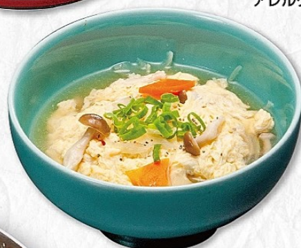
白クッパ 490円 (税込539円) アレルギー(特定原材料) 小麦・卵