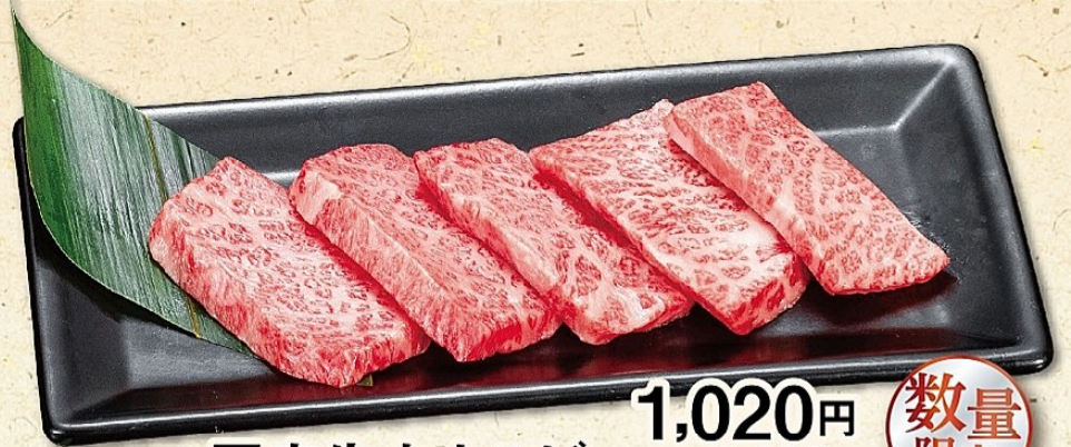
国産牛上カルビ 1,020円 (税込1,122円)