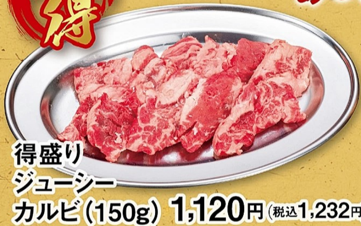
得盛り ジューシー カルビ (150g) 1,120円 (税込1,232円)