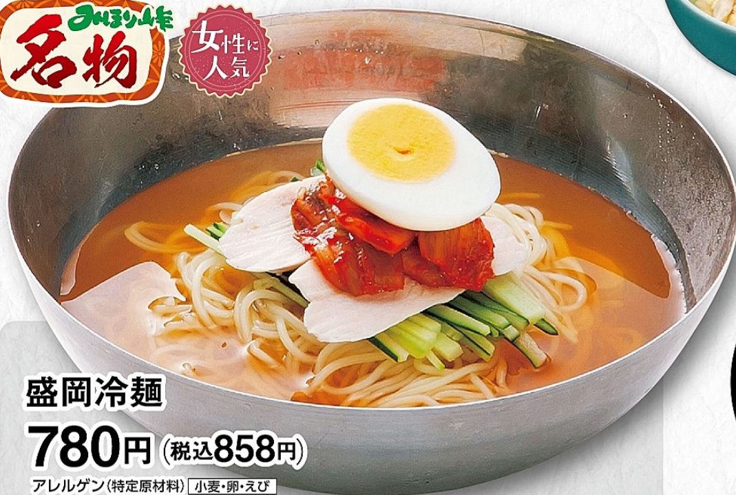
盛岡冷麺 780円 (税込858円) アレルギー(特定原材料) 小麦・卵・えび