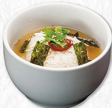
梅クッパ 390円 (税込429円) アレルギー(特定原材料) 小麦・卵