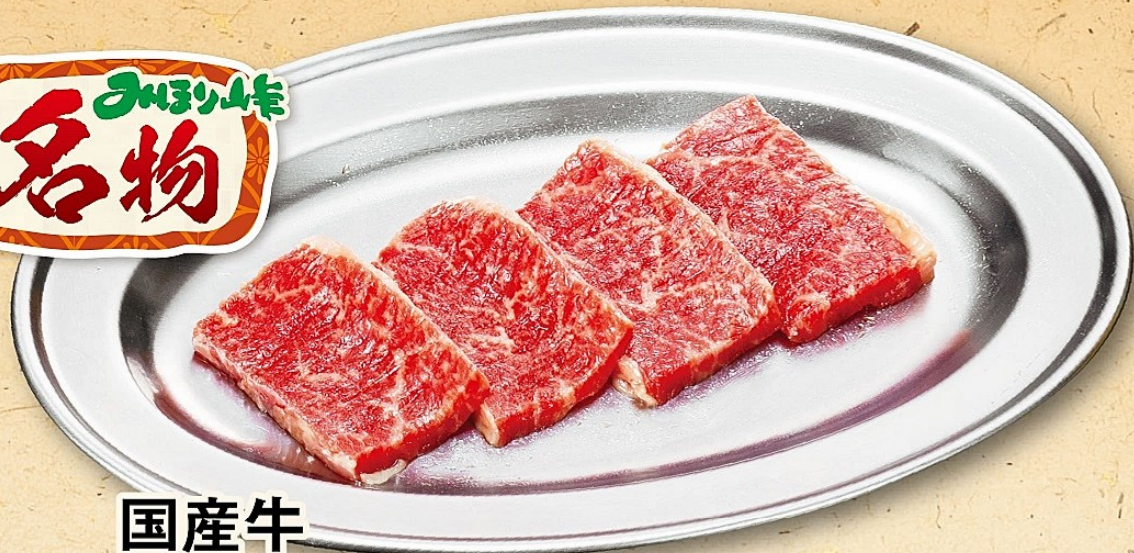
国産牛 ぶち旨カルビ 410円 (税込451円)