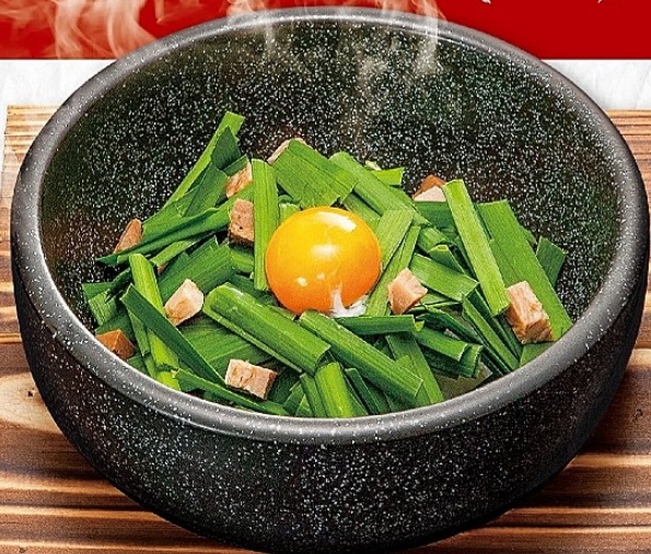
石焼ニラガーリック ライス 830円 アレルギー(特定原材料) 小麦・卵 (税込913円)