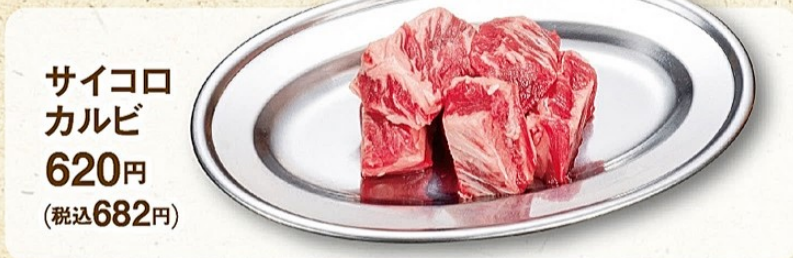
サイコロ カルビ 620円 (税込682円)