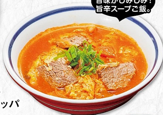
旨辛赤クッパ 690円 (税込759円) アレルギー(特定原材料) 小麦・卵