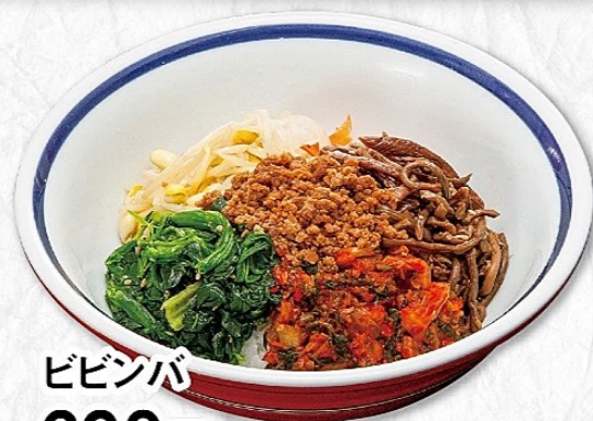
ビビンバ 690円 (税込759円) アレルギー(特定原材料) 小麦・えび