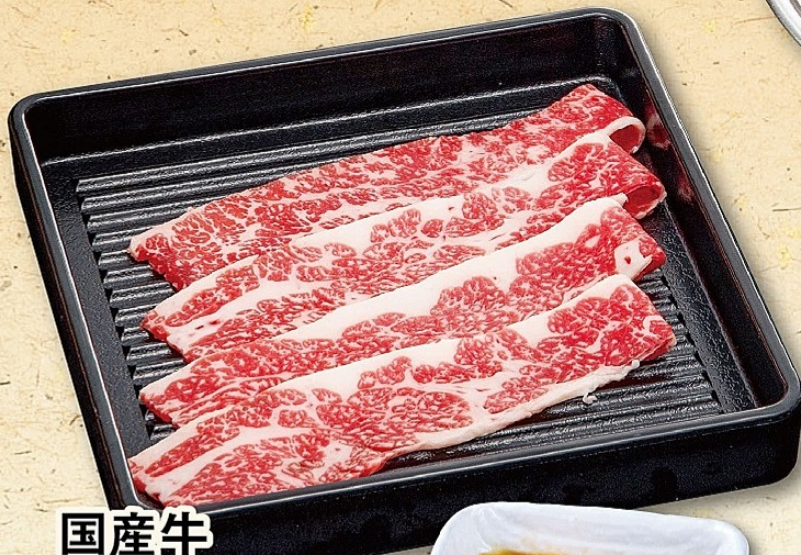
国産牛 ・焼すきカルビ (卵黄とタレ)