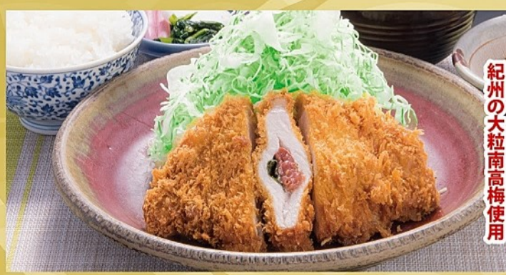
紀州の大粒南高梅使用