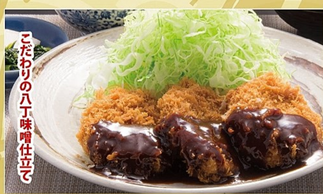
こだわりの八丁味噌仕立て

和風ネギおろし膳 ローズ 1450円 (税込1595円) ヒレ 1550円 (税込1705円)