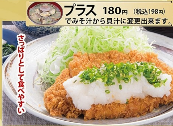
せりせりとして食べやすい

美味しい感動 カツカレー ローズ 1150円 (税込1265円) ヒレ 1150円 (税込1265円)