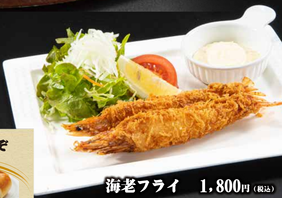
海老フライ 1,800円 (税込)