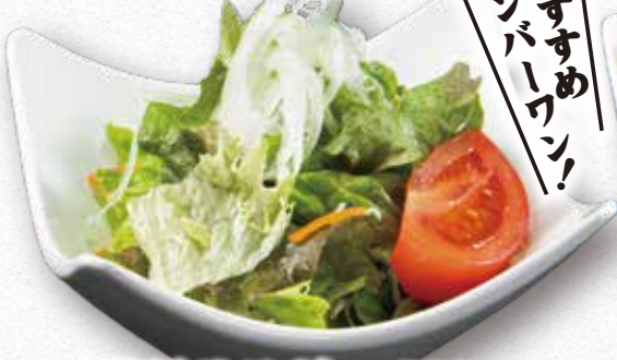
単品サラダ 300円 (税込) ※仕入れの状況により内容が変わります。