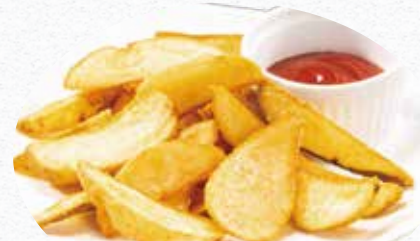
ポテトフライ 330円 (税込)