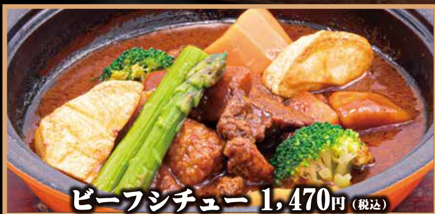
ビーフシチュー 1,470円 (税込)