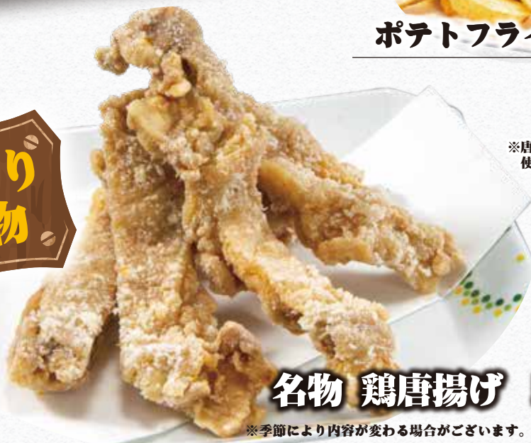
名物 鶏唐揚げ 580円 (税込)