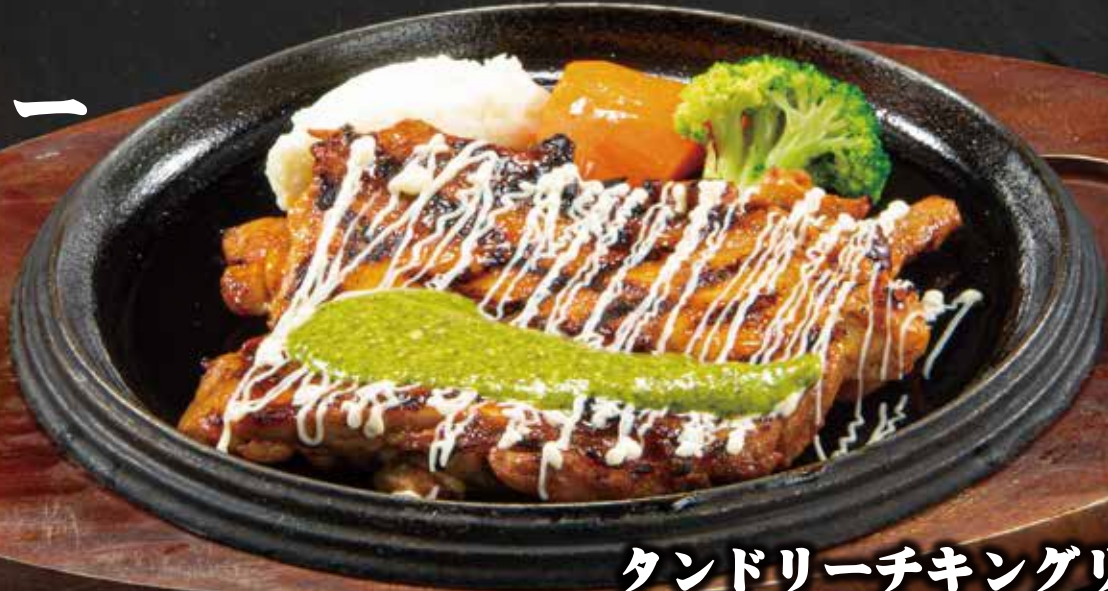
タンドリーチキングリル 980円 (税込)