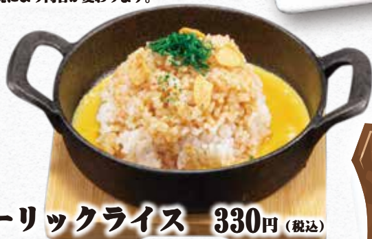
ガーリックライス 330円 (税込)