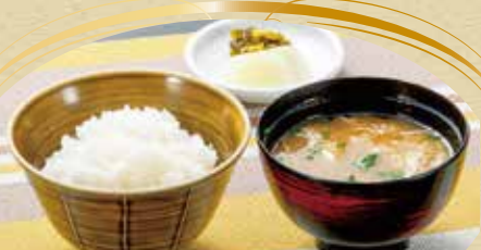
和風セット 380円 (税込) ご飯 + 漬物 + 味噌汁