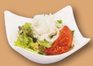
サラダ 300円 (税込)