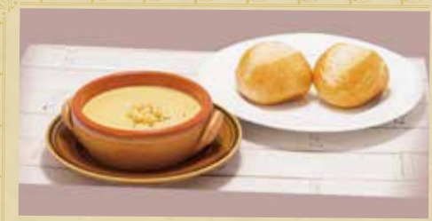
洋風セット 450円 (税込) ライスorパン + スープ