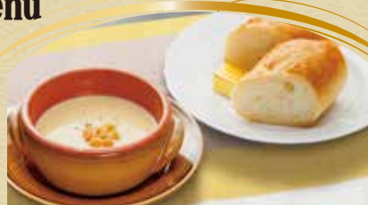
洋風セット 450円 (税込) ライスorパン + スープ