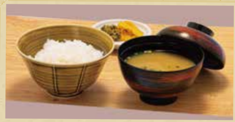
和風セット 380円 (税込) ご飯 + 漬物 + 味噌汁