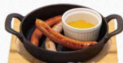
ウィンナー盛り合わせ 850円 (税込)