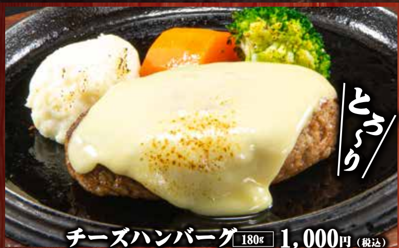
チーズハンバーグ 180g 1,000円 (税込)